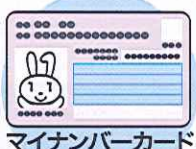
マイナンバーカード